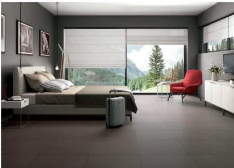
Sommers wie winters das perfekte Barfuß-Klima: Keramische Fliesen in Kombination mit einer Fußbodenheizung sind ein ideales Paar, wenn es darum geht, wohngesunde Energiespar-Wärme zu erzeugen. 010 01

Diese Textversion sowie zwei weitere Versionen können Sie im Internet herunterladen.