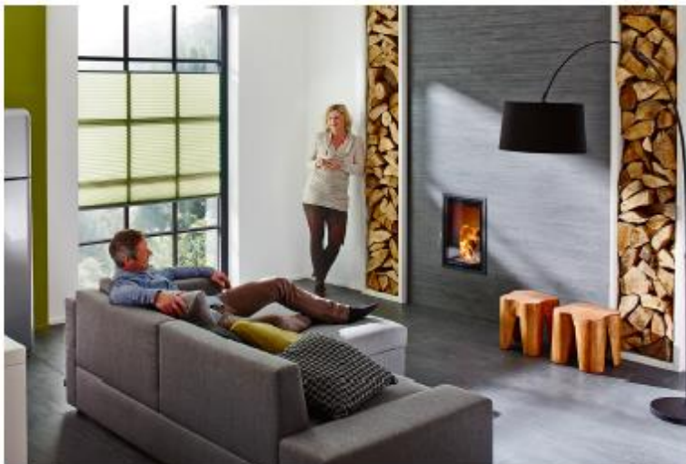
Baustoffe sowie Material und Verarbeitung von Boden- und Wandbelägen beeinflussen maßgeblich die Luft und damit unser Raumklima – mit Keramikfliesen ist man auf der sicheren Seite. 001 01

Mit diesem Link gelangen Sie direkt zum Download der Texte und Bilder für Ihre Pressearbeit http://www.easy-pr.de/publish/37adc90e_99dd_9ee9_beda82bea979a081.cfm?search_text=VDF&y=0&x=0