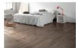
Ob im Bad, in der Küche oder wie hier im Schlafzimmer: Keramikfliesen machen überall eine gute Figur und tragen zu einem gesunden Raumklima bei. 001 03

Alle Texte und Bilder können kostenfrei mit Quellenangabe verwendet werden.