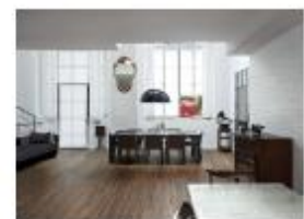
Keramik-Fliesen überzeugen als natürlicher und angenehmer Bodenbelag, da sie – wie ein Kachelofen – Wärme speichern und langsam wieder abgeben. Das sorgt für rundum wohngesunde Energiespar-Wärme. 010 02

Mit diesem Link gelangen Sie direkt zum Download der Texte und Bilder für Ihre Pressearbeit http://www.easy-pr.de/publish/37adc90e_99dd_9ee9_beda82bea979a081.cfm?search_text=VDF&y=0&x=0