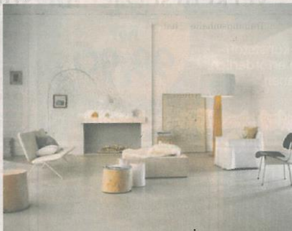
Ein Boden aus keramischen Fliesen in Kombination mit einer Fußbodenheizung ist nicht nur optisch ein Gewinn, sondern trägt auch zur Wohngesundheit bei.

Maßnahmen zur Dämmung und einer damit einhergehenden Energie- und Heizkostenreduzierung gibt es viele, doch oft sind diese recht kostspielig. Ein Energiesparsystem, das natürlich, gesund, langlebig und robust sowie einfach und ohne aufwen-